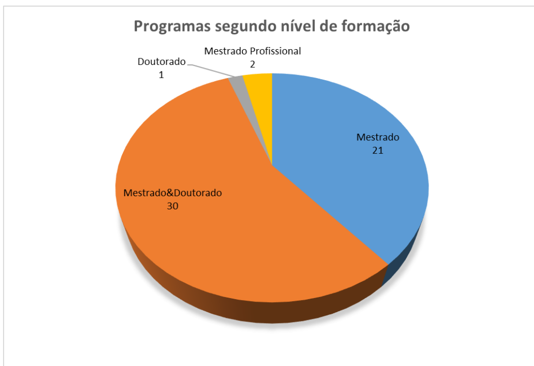
Gráfico 1 – Distribuição dos Programas de Pós-graduação na área de avaliação de Sociologia por nível de formação (Plataforma Sucupira. CAPES, 2016).

Os gráficos abaixo não incluem o ProfSocio, mestrado em Rede da Sociologia, aprovado este ano com nota 3 (três), uma vez que ainda não iniciou suas atividades.