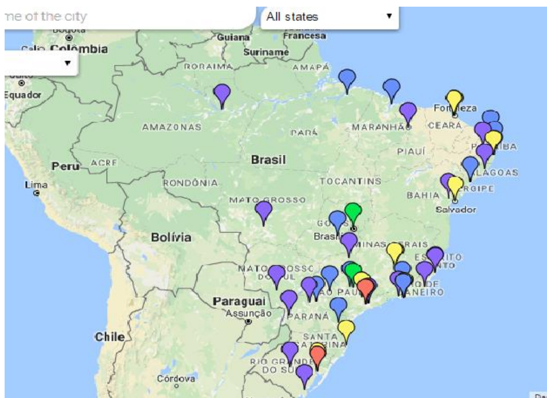
Mapa 1 – Distribuição geográfica dos Programas de Pós-Graduação da área de Sociologia no Brasil. As cores do mapa representam notas da Avaliação Trienal 2013: vermelho = 7; verde = 6; azul = 4; amarelo = 5; roxo = 3.